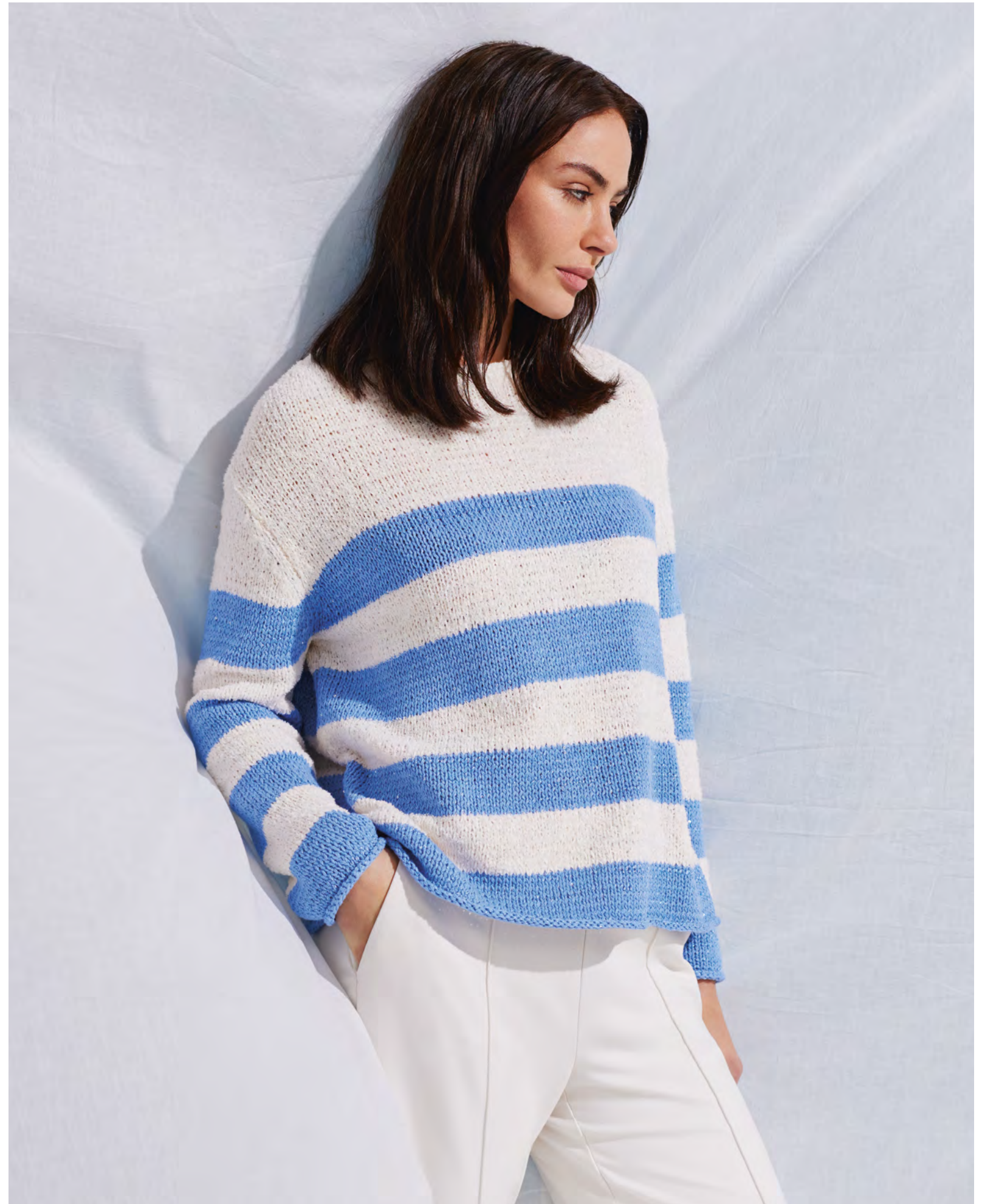
Pullover 54-613 600 · Hose 54-610 454