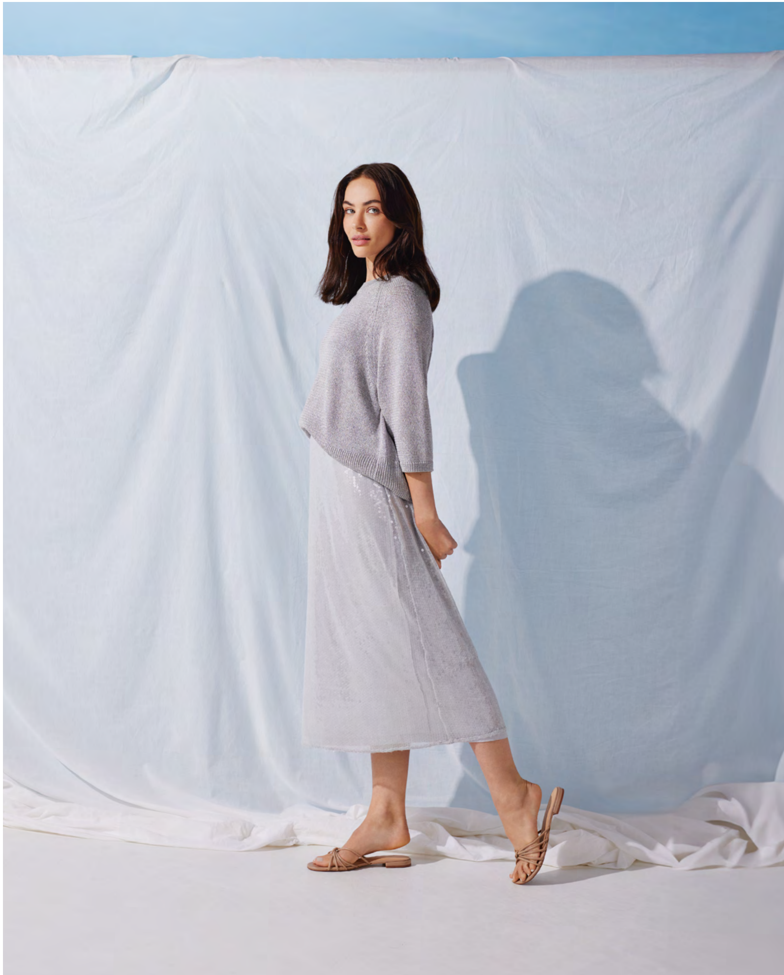
Pullover 54-614 600 · Rock 54-614 141