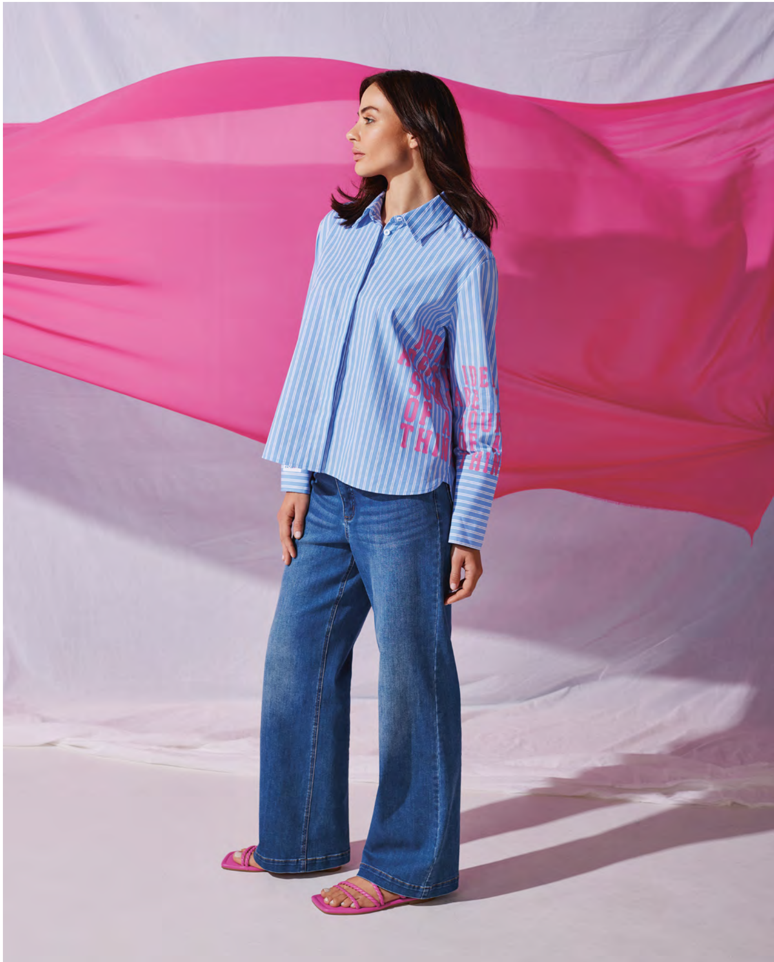
Bluse 54-613 102 · Hose 54-610 152