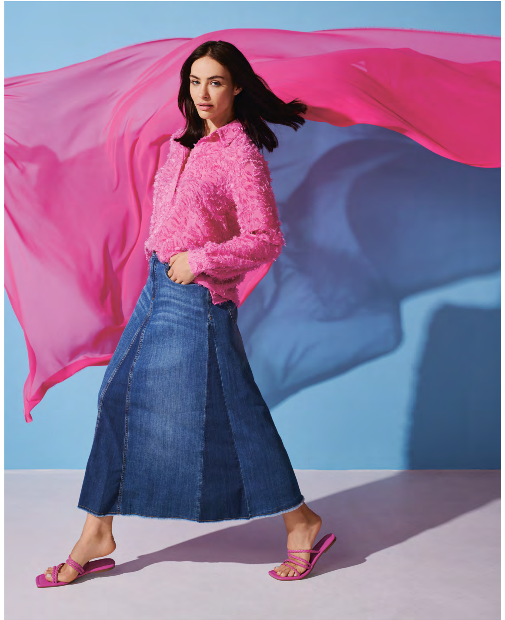
Bluse 54-613 106 · Rock 54-613 140