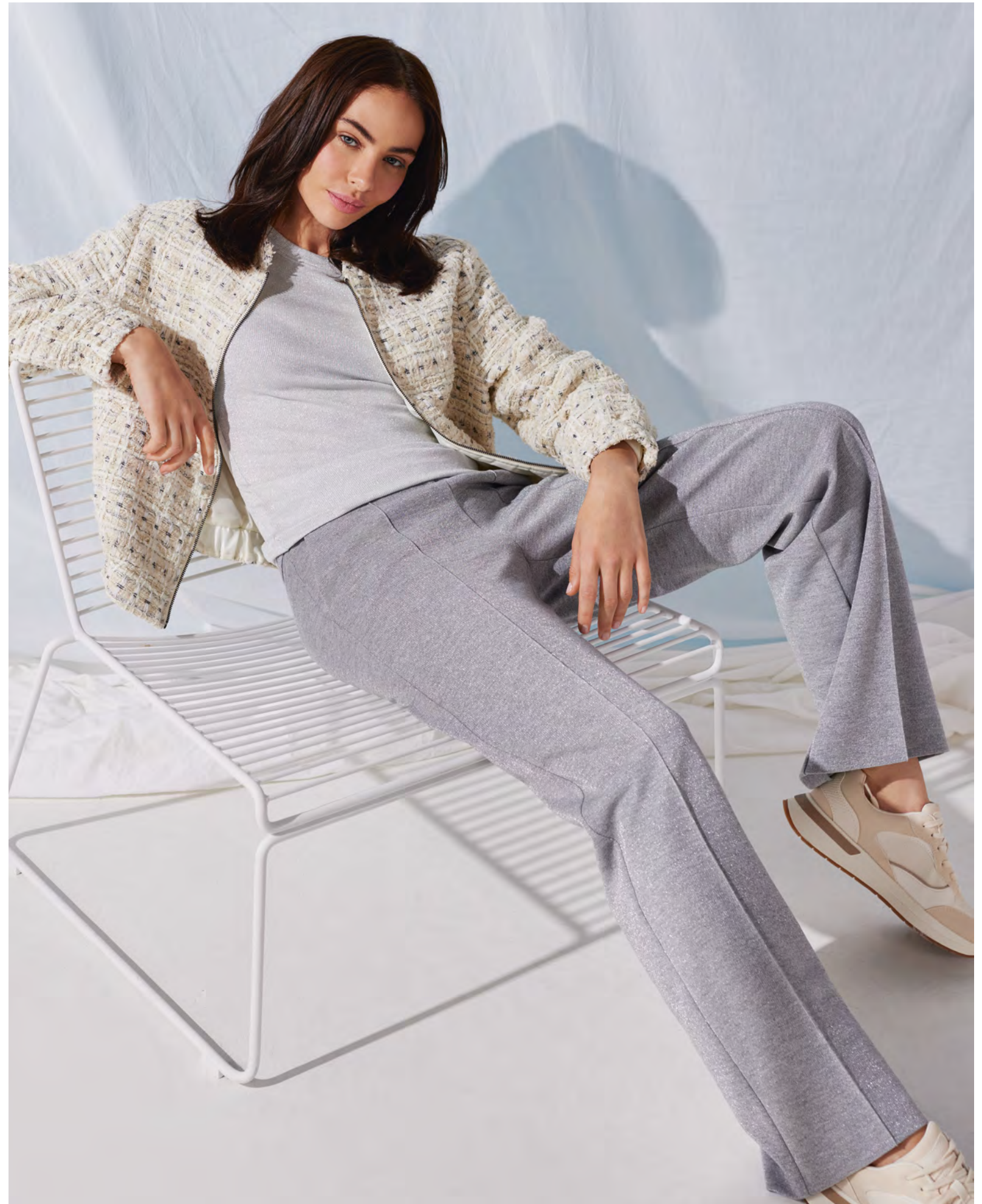
Jacke 54-614 020 · Shirt 54-610 302 · Hose 54-614 450