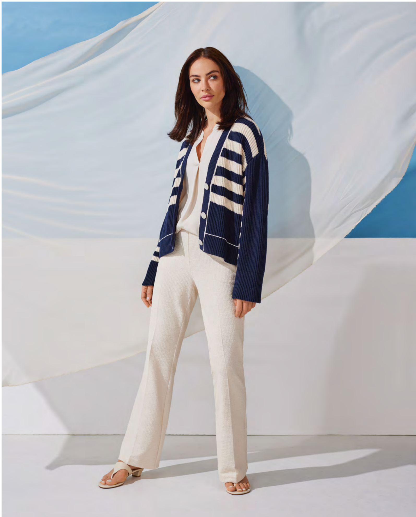
Jacke 54-611 522 · Bluse 54-610 100 · Hose 54-611 450