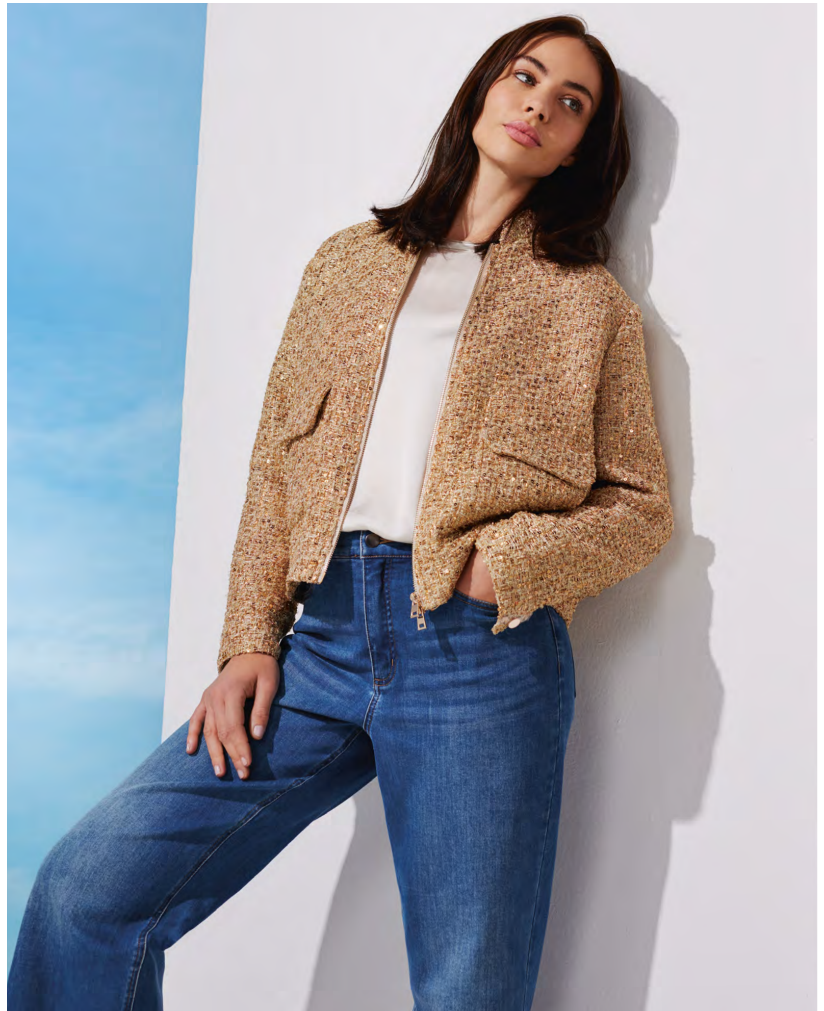
Jacke 54-611 020 · Shirt 54-610 304 · Hose 54-610 152