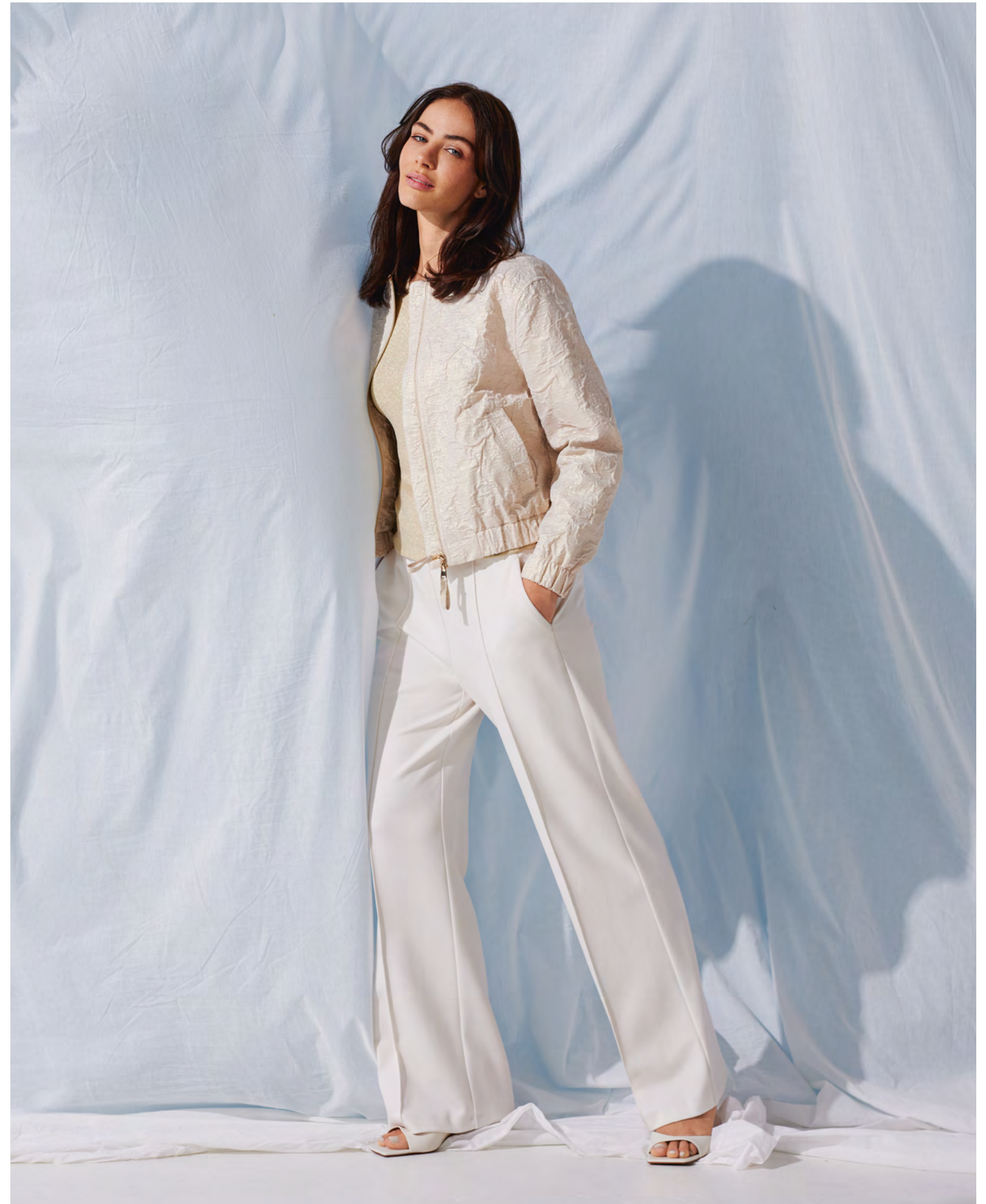
Jacke 54-611 022 · Shirt 54-610 302 · Hose 54-610 454