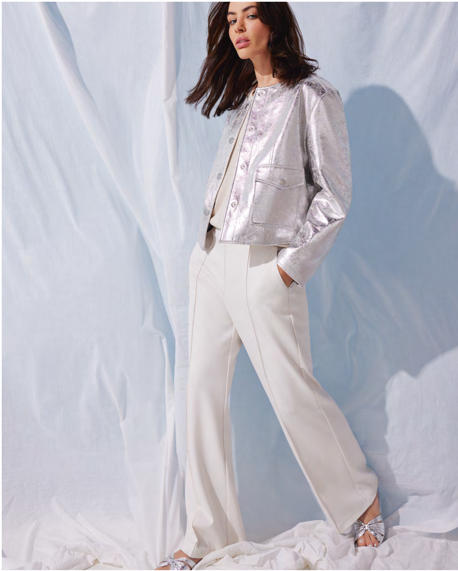
Jacke 54-614 021 · Shirt 54-614 308 · Hose 54-610 454