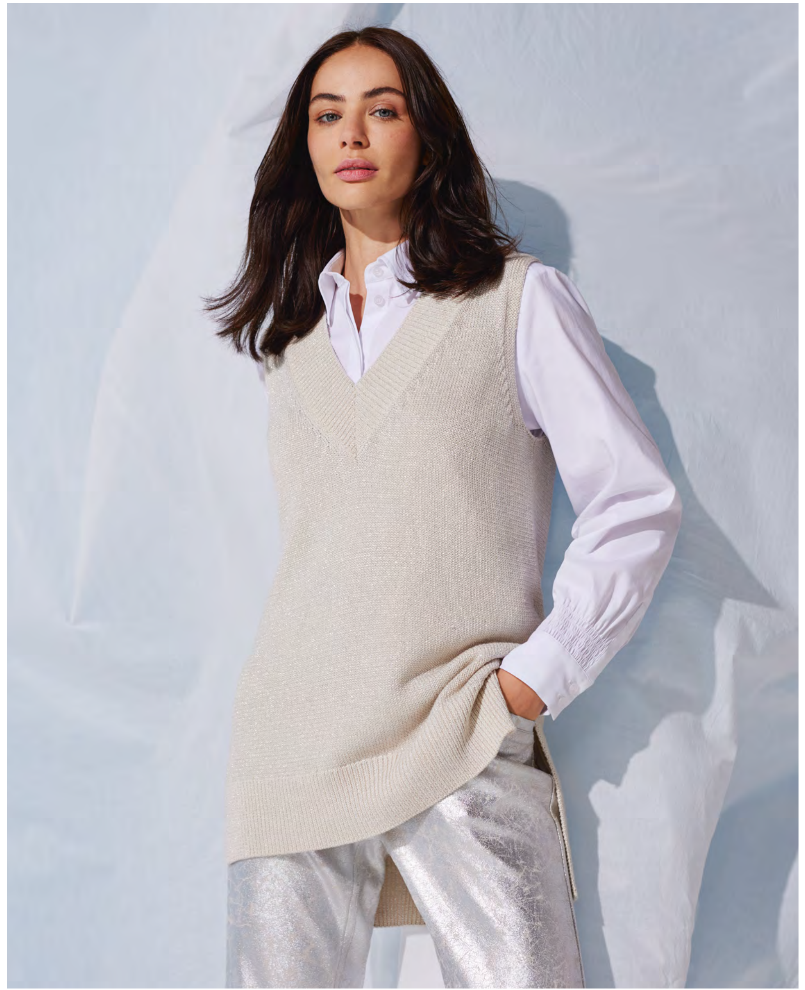
Pullunder 54-614 700 · Bluse 54-610 101 · Hose 54-614 150