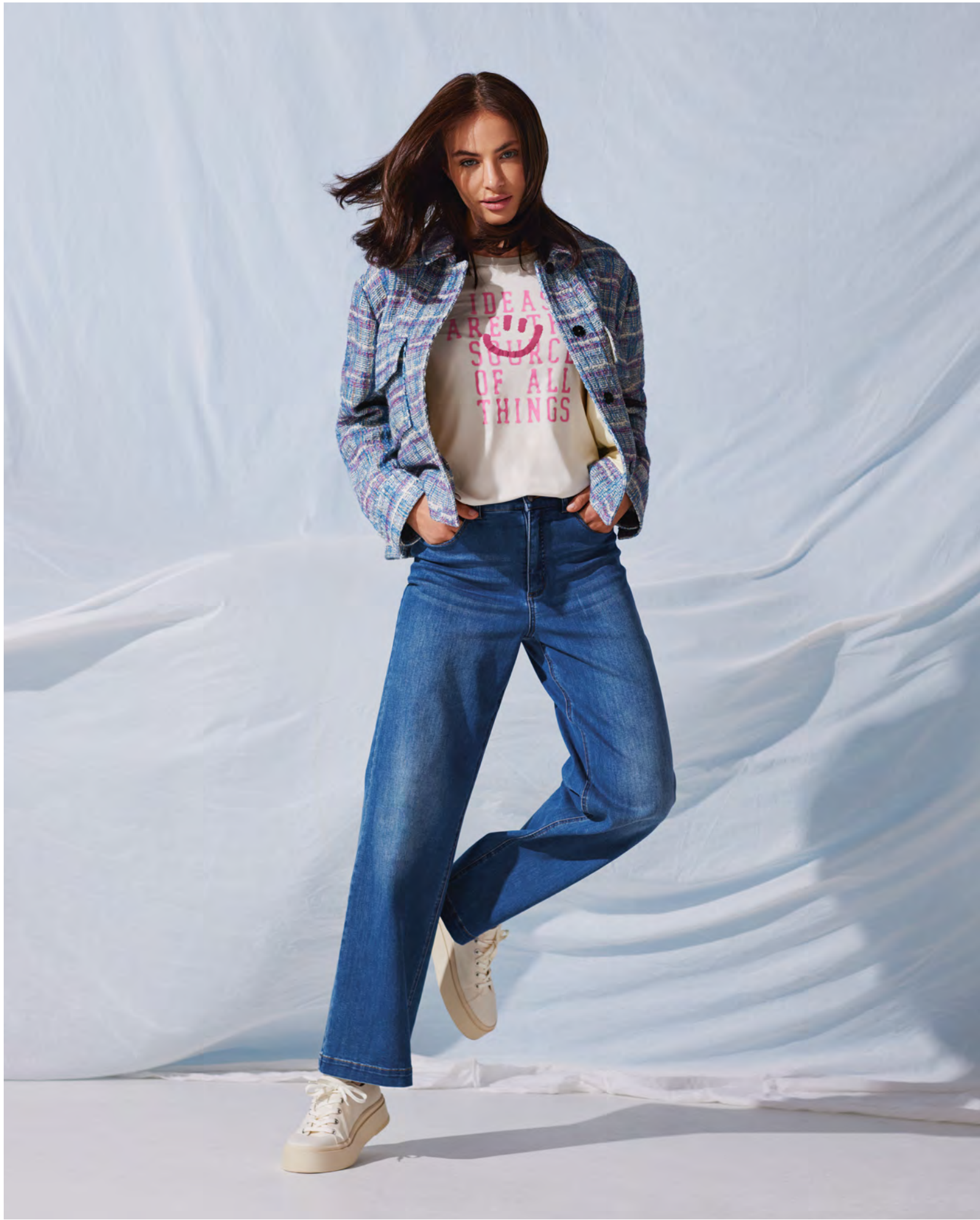
Jacke 54-613 021 · Shirt 54-613 303 · Hose 54-610 152