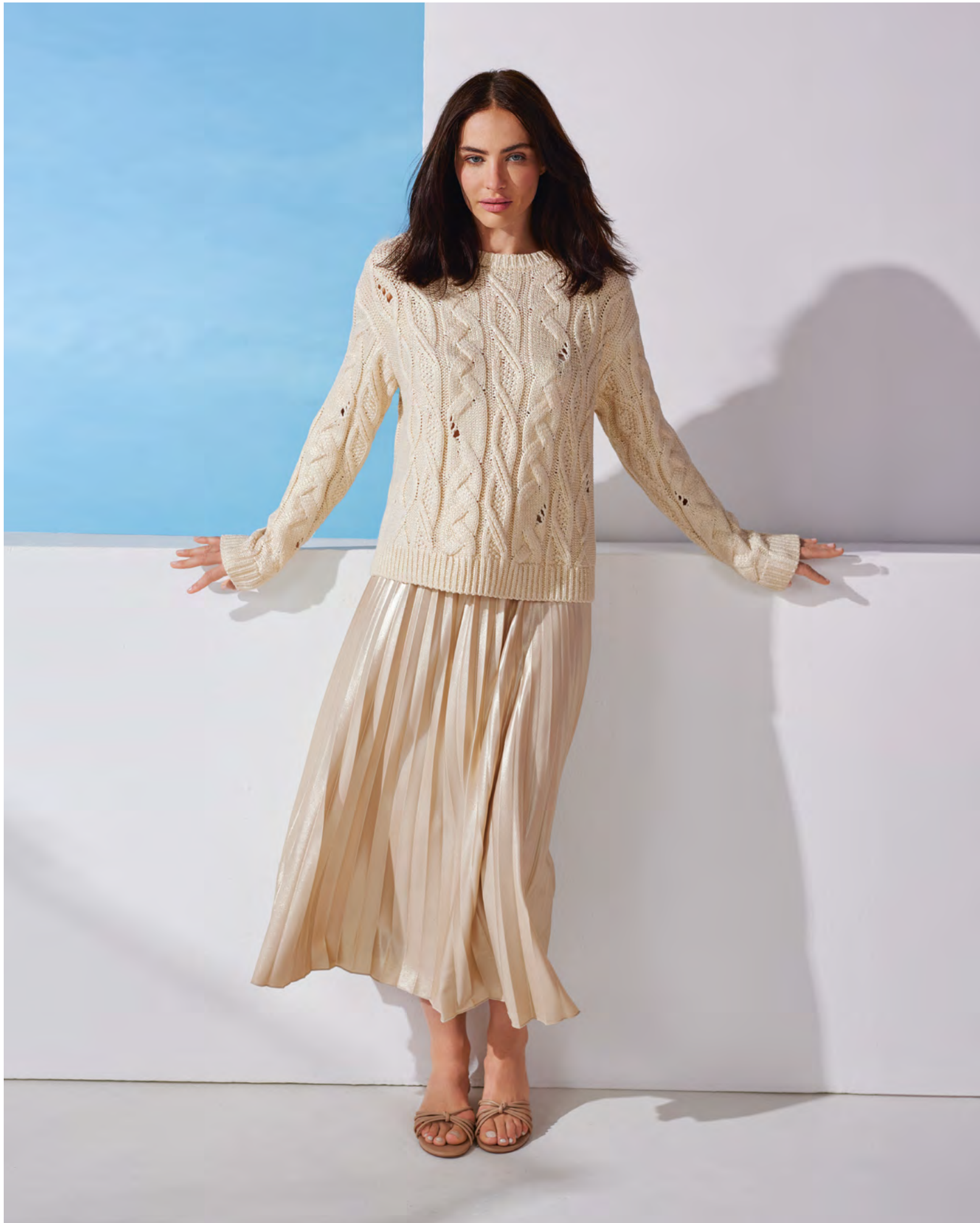
Pullover 54-611 601 · Rock 54-611 140